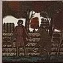
Maisonneuve & Larose

L es Contes populaires russes d'Afanassiév sont l'un des recueils de contes les plus importants de l'Europe du XIX e siècle. Ils sont remarquables par la grande richesse et la variété des textes (près de six cent dans l'édition complète). Ces contes ont été relevés dans la Russie encore à demi analphabète du milieu du siècle dernier et représentent ainsi la tradition orale comme aucun autre recueil n'a été en mesure de le faire depuis. Tous les grands contes-types y figurent. Par ailleurs, dépassant l'expérience des frères Grimm, Afanassiév a été plus un rassembleur qu'un rédacteur de contes et cela fait la modernité de son ouvrage.